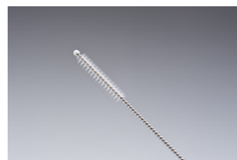
吸引歯ブラシ「吸ty シリーズ」